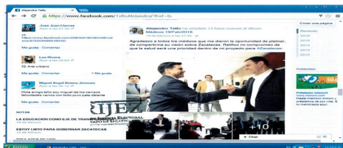
magen relacionada con el Punto Segundo de la presente Acta.

Instituto Electoral del Estado de Zacatecas Secretaría Ejecutiva Oficialía Electoral