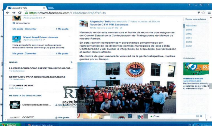
Imagen relacionada con el Punto Segundo de la presente Acta.

Instituto Electoral del Estado de Zacatecas Secretaría Ejecutiva Oficialía Electoral