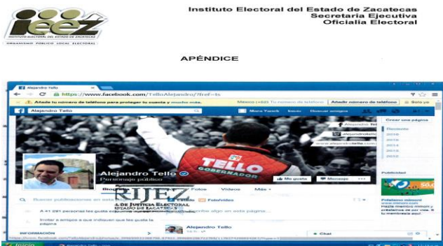
Imagen relacionada con el Punto Primero de la presente Acta.